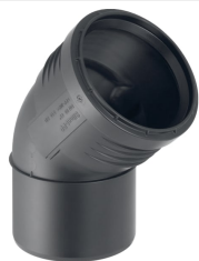
Figura di esempio