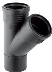
Figura di esempio